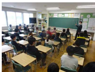
「国語体験授業のようす」