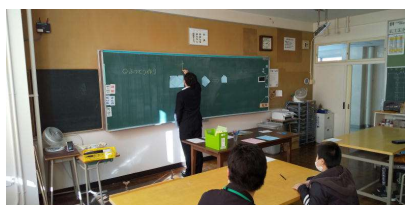
「特別支援学級体験のようす」

今年度は、体験入学の他に、本校教諭が本校区の3小学校に出向き授業をする「乗り入れ授業」を数学で実施しました。さらに、大成小学校では英語、糸井小学校では体育の出前授業を実施しました。