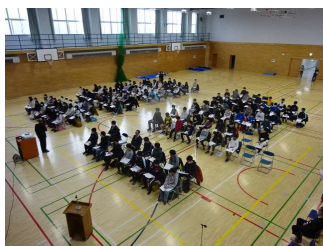
「全体説明のようす」

2月15日（木）に新入生体験入学、16日（金）に特別支援学級の新生体験入学を実施しました。本校では、中学校生活に関する説明の他、授業体験を実施しており、少しでも中学校入学への不安を軽減できるよう取組を進めています。